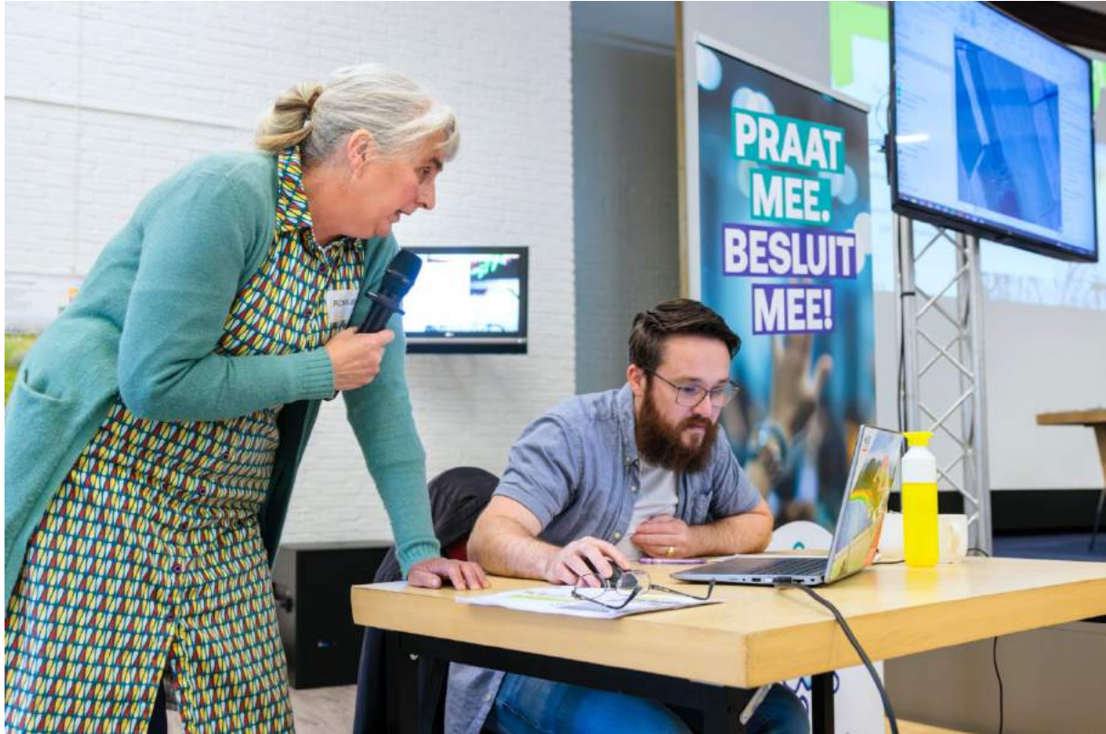
Samen met de tekenaar kijken naar inpassing op de plankaart.