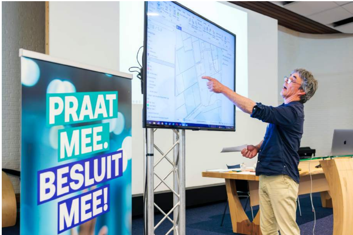
Aanwijzen plek op de kaart van het initiatief.