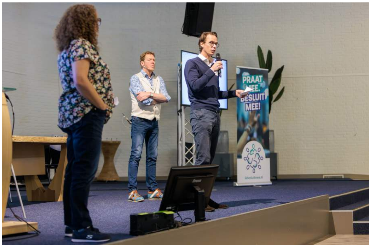
Uitleg geven over initiatief aan de oostkant van het gebied.